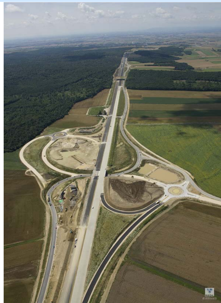
участък- носеща конструкция- обкръжаваща среда