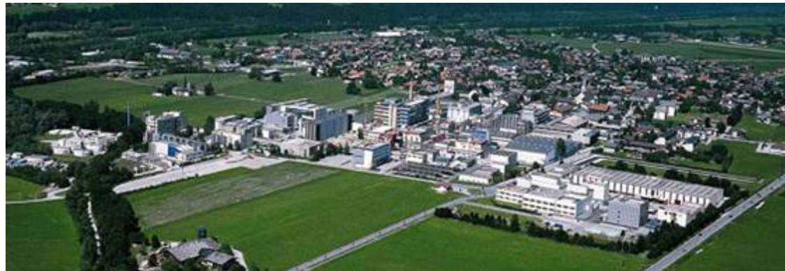
オーストリア – 微生物及び細胞培養バイオテックの拠点