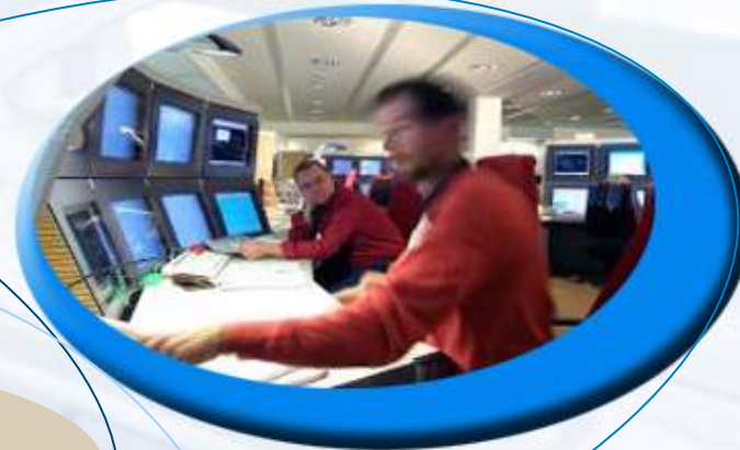
セキュリティと制御