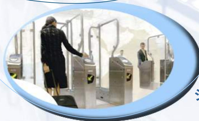
シームレスな旅行