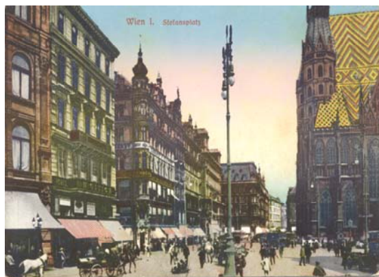
シュテファンプラッツ、1900年頃の絵葉書

伝統的な建造物の中に現代がうまく溶け込ませた実例の中で最も目を引くのは、ウィーンのシュテファン広場です。ここには、ゴシック様式のシュテファン寺院のすぐ隣に、1990年ポストモダンのパイオニアの一人、ハンス・ホラインの設計でハースハウスが建てられました。特に鏡面ガラスの出窓がこの建物に都市型建築のアクセントを与えています。そのため、長きに渡ってオーストリア戦後史の中で最も議論を呼んだ建築物でもありました。