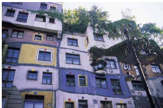
フンデルトヴァッサーハウス

オーストリアのイメージを決定付ける建築家は、ホラインだけではありません。他の例では、画家としての活動と並行して種々の建物をデザインしたのが、環境保護芸術家として世界的に著名フリーデンスライヒ・フンデルトヴァッサー(1928-2000年)です。ウィーンのフンデルトヴァッサーハウスは、今では、オーストリアで最もビジター数の多い建物のひとつとなりました。この建造物には、52戸の住宅と、4つの商業物件が入っています。この住宅や商業物件の一つ一つが、独自の色を持ち、全部で250の樹木や灌木によって豊かな緑にあふれています。この遊びのある建築は、蜃気楼をイメージしたものです。日本でも、フンデルトヴァッサーによりデザインされた大阪市のごみ処理工場「舞洲工場」と汚泥集中処理場の「舞洲スラッジセンター」があります。