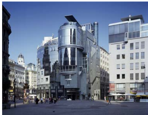
正面から見たハースハウス

オーストリアには斬新な現代建築がたくさんあります。建築の過去と現代がこれほど完璧に融和している国も珍しいでしょう。