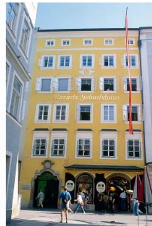
現在の様子、写真提供オーストリア観光局

ウィーンの王宮庭園やザルツブルク訪れたことのあるならば、モーツァルト記念碑を目にしたことだろう。実際にモーツァルトが、どういう容姿であったのかは、繰り返し問われてきた。絵画、銅像もしくはチョコレートのパッケージの絵であれ、誰もがモーツァルトの肖像を知ってる。しかし、もしかするとモーツァルトの容姿は私達が知るものとは違っていただかもしれない。1900 年頃の絵葉書には様々な年齢のモーツァルトが、それぞれ異なった風貌で描かれている。