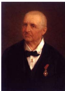
歩むことを決意する。