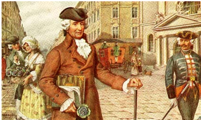
ヨーゼフ・ハイドン (1920年頃の絵葉書)

ハイドンは1732年3月31日にニーダーエースターライヒのローラウで生まれ、1809年5月31日オーストリアのグンペンドルフにて逝去した。ハイドンは、ウィーンのクラシック音楽界における、リーダー的作曲家だった。ハイドンは音楽生活の大部分を、裕福な貴族であるエステルハージー家のアイゼンシュタットの屋敷においてオーケストラの運営、室内楽の演奏、オペラ作品の上演などの責任者として過した。フランツ・ヨーゼフ・ハイドン(彼は一度もフランツという名を名乗らなかった)の死後100年目を記念し、絵葉書が作られた。下の絵には、ウィーンのホーフブルク宮殿の前に立つハイドンが描かれており、1909年の消印がある。