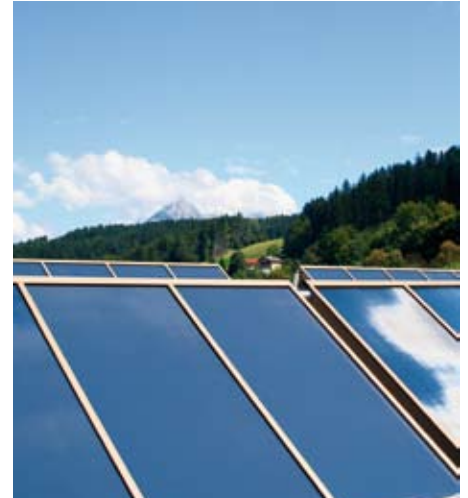
Machen aus dem Dach des MOGUNTIA-Werkes ein Wärmekraftwerk: die TiSUN-Großflächenkollektoren