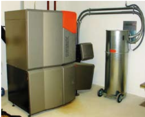
Biomasseheizung „GUNTAMATIC2“ GUNTAMATIC2 biomass heating system

Der Gunkskirchner Unternehmer Biringer heizt mit einer GUNTAMATIC-Kaskadenanlage.