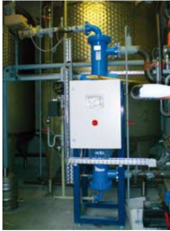
Der neu installierte, mit Hackschnitzel befeuerte 700-kW-Dampfkessel von Schiff & Stern

Die 1757 gegründete Privatbrauerei Hainfeld in Niederösterreich ist ein solides, erfolgreich geführtes Privatunternehmen, das für seine exzellenten Biere bekannt ist. Im Jahr 2007 war die dringende Erneuerung der Dampfkesselanlage notwendig. Die Eigentümerfamilie erkannte die Chance, bei dieser Investition Ihre Geschäftstätigkeit um eine Nahwärmeversorgung zu erweitern. Dabei sollte ein neu installierte mit Hackschnitzel befeuerte 700-kW-Dampfkessel, der zur Gänze für die Nahwärmeversorgung benötigt wird, auch den Sudbetrieb der Brauerei mit Spitzen bis zu 300 kW abdecken.