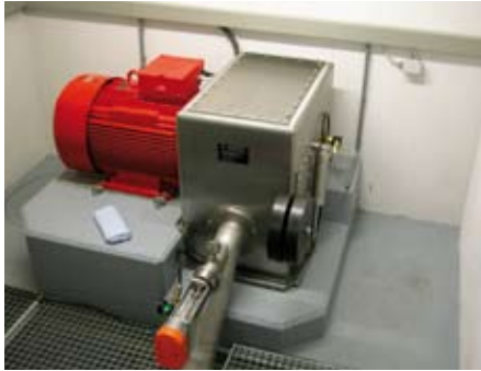
Trinkwasserkraftwerke sind umweltfreundlich, günstig und haben einen hohen Wirkungsgrad

Drinking water power plants are environmentally friendly, economical and highly efficient