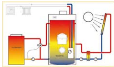
Heizsystem mit Solar und Holz Combined solar and wood heating system

Die EU-Kommission fordert unter anderem im noch druckfrischen EU-Klimaschutzbericht den Einsatz von erneuerbaren Energieträgern, wie etwa Sonne und Holz. Kurzum: Gefragt sind „Wohlfühlheizungen“, die effizient und kostengünstig sind. Die OLYMP-Gruppe zeichnet sich durch Innovation und Familienfreundlichkeit aus. Als Referenzanlage gilt beispielsweise