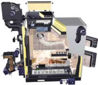
Schnitt durch einen modernen Heizkessel der Firma Fröling Cross section of a modern heating boiler from Fröling

Deutschland ist (nicht nur) für Fröling der größte Auslandsmarkt. Frankreich und Großbritannien seien stark im Kommen. „Aufgrund von Förderungen für mittlere und größere Projekte sind dort auch große Anlagen gefragt“, sagt Hutterer. Die größ-