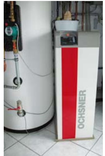
Ochsner Golf GMDW 7 Ochsner Golf GMDW 7

Die Firma Ochsner Wärmepumpen GmbH hat in Zusammenarbeit mit unabhängigen Forschungsinstitutionen eine neuartige CO 2 -Sonde entwickelt. Die Nutzung der Erdwärme erfolgt dabei über eine CO 2 -Sonde in Kombination mit einem System zur Direktverdampfung. Dabei zirkuliert das Arbeitsmittel der Wärmepumpe als Wärmeträgermedium im Kühlkopf der CO 2 -Sonde und kommt dort zum Verdampfen. Durch diese direkte Verdampfung ergeben sich höchste Leistungsziffern und größte Betriebssicherheit, da Umwälzpumpen nicht benötigt werden.