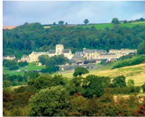
Das Ampleforth College setzt auf die umweltfreundliche und komfortable Heiztechnik aus Österreich Ampleforth College relies on environmentally friendly and comfortable heating equipment from Austria

Ein Kessel der Serie Turbomat von Fröling verwöhnt die Schüler im anerkannten Ampleforth College nahe dem englischen York mit angenehmer Wärme aus Biomasse.