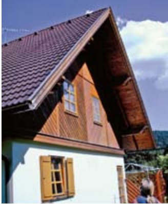
Das Haus der Familie Strasser in Kärnten mit der Pellets-Heizanlage FIRE FOX PK The Strassers' home in Carinthia heated with a pellet-operated FIRE FOX PK system

Als junges Unternehmen aus Kärnten entwickelt und vertreibt EN-TECH zukunftsweisende Heizsysteme.