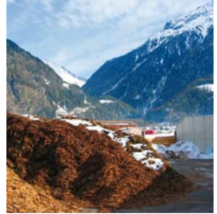
Das Biomasse-Heizkraftwerk versorgt die Tiroler Therme und den Ort Längenfeld

Noch vor kurzem war der Ort Längenfeld ein kleiner, ein wenig verschlafener Ort zu Füßen der hochaufragenden Dreitausender in den Ötztaler Alpen. Seit Herbst 2004 strahlt von Längenfeld aus weit über das Ötztal hinaus die Tiroler Therme Längenfeld, der Aqua Dome, ein Thermenzentrum mit abgeschlossenem Vier-Sterne-Hotel. Thermalwasser hat in Längenfeld eine jahrhundertalte Tradition. Der Aqua Dome ist als ganzheitlich orientierter Gesundheitstempel konzipiert und soll täglich bis zu 1.000 Besucher anziehen. Um den Energiebedarf der Region abzudecken, hat die Tiroler Wasserkraft AG in unmittelbarer Nachbarschaft ein Biomasseheizkraftwerk errichtet. Polytechnik hat dazu die gesamte Feuerungstechnik geliefert. Mittlerweile ist das Heizkraftwerk in Betrieb und versorgt die Therme und die fast 4.000 Haushalte im Ort mit Wärme und Strom aus dem heimischen Energieträger Holz. Strom wird mittels eines ORC-Prozesses und einer Turbine gewonnen. Die elektrische Leistung des Generators beträgt 1.100 kW. Bürgermeister Willi Kuen „ist froh, dass Längenfeld kein Öl mehr verheizt, dass sich die Luft deutlich verbessert hat und noch weiter verbessert wird.“ www.polytechnik.com