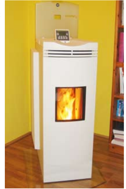
Stilvoll zentralheizen im Wohnzimmer – der neue FireWIN vereint gemütliche Kaminatmosphäre mit innovativer Heiztechnologie