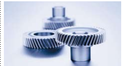
MIBA errichtet ein Produktionswerk für Sinterformteile in McConnellsville, Ohio MIBA is building a factory for the production of sintered metal components in McConnellsville, Ohio.

Der oberösterreichische Autozulieferer MIBA errichtet um 16,5 Millionen US-Dollar (10,41