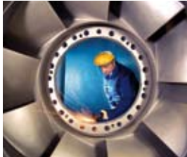
30-Millionen-Euro-Auftrag zur Erneuerung eines Wasserkraftwerks für Andritz VA Tech Hydro auf den Philippinen Andritz VA Tech Hydro lands a 30-million-euro contract to modernize a hydroelectric power station in the Philippines

Einen Auftrag mit einem Volumen von etwa 30 Millionen Euro zur Modernisierung eines Wasserkraftwerks auf den Philippinen erhielt die zum börsennotierten Technologiekonzern Andritz AG gehörende Andritz VA Tech Hydro. Durch die Sanierung des seit 1972 laufenden Wasserkraftwerks Pantabangan auf Luzon soll auch die Leistung von 104 auf 122 MW gesteigert und die Lebensdauer der Anlage um weitere 30 Jahre verlängert werden. Der Auftrag umfasst den Austausch von zwei 52-MW-Francisturbinen, neue Generatorwicklungen sowie die Modernisierung der gesamten elektronischen Anlage.