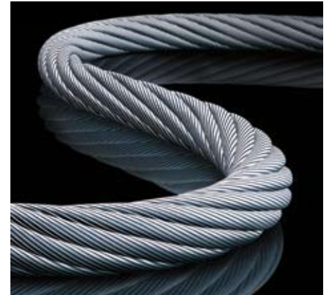
Teufelberger-Stahlseil Teufelberger steel wire rope

systemen stellt es qualitativ hochwertige Spezialstahlseile her. Das Geschäftsfeld „Wire Rope der Teufelberger-Gruppe“ konzentriert sich auf Forschung & Entwicklung, Fertigung, Marketing sowie den Vertrieb von hochwertigen Spezialeilen aus Stahl. Zwei Produktionsstandorte und 190 Mitarbeiter sorgen für eine jährliche Absatzmenge von rund 6 Mio. Meter Stahlseil. Hauptabnehmer sind Erstausrüster, Händler sowie Endverbraucher für Seilbahnen und Krananwendungen in den Bereichen Trans-