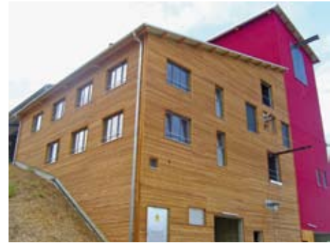
Außenansicht Heizzentrale View of a heating control center from the outside

The 5,000 kW biomass boiler was supplied by Polytechnik, a company based in the Austrian province of Lower Austria. Hauzenberg and Wegscheid have already had positive experiences with this make of boiler. The firing plant for the biomass plant was delivered in sections and then brick-lined on site with nearly 60 tons of refractory clay. The heating boiler is fitted with an oil-operated heat exchanger instead of the usual water-operated heat exchanger. About 13,000 liters of thermal oil are put in the heating circuit. Maxxtec AG from Sinsheim supplied the thermal oil-operated heaters. A dry electrofilter from Scheuch, Auroldmünster, ensures compliance with the required limit values. Emission values are automatically recorded