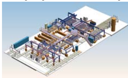
Das ASH-System von Schelling The ASH system from Schelling

Der Spezialist für Plattenaufteiltechnologie, Schelling Anlagenbau, erhielt den Zuschlag für