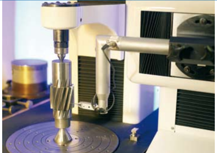
Höchste Präzision: Antriebstechnik von Watt Drive Maximum precision: Drive technology from Watt Drive