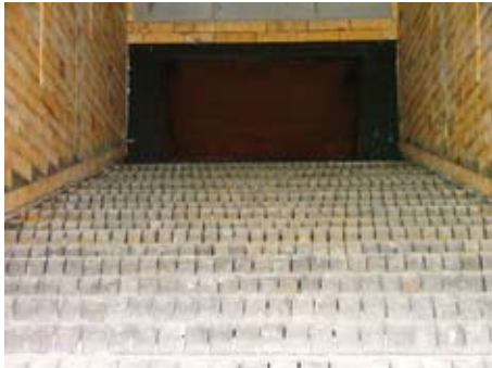
Die Polytechnik-Feuerung. Blick in den Verbrennungsraum auf den hydraulischen Vorschubrost A firing plant from Polytechnik. View of the grate firing unit in the combustion chamber

Um die Wertschöpfung zu erhöhen und den schleppenden Waldhackgutabsatz zu kompensieren, entschieden sich drei bayrische Waldbauernvereine (Wegscheid, Passau und Freyung-Grafenau) für ein gemeinsames Biomasseheizkraftwerk mit dem