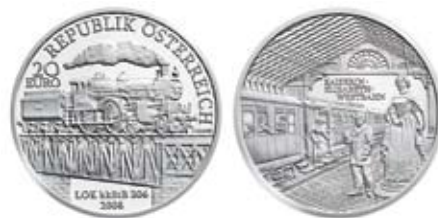
Zum 150-Jahr-Jubiläum der ersten Westbahn-Strecke erscheint aus der Reihe „Österreichische Eisenbahnen“ die 20-Euro-Münze „Kaiserin-Elisabeth-Westbahn“ The 20 euro commemorative coin “Empress Elisabeth Western Railroad” was issued as part of the Austrian Railroads series to mark the 150th anniversary of the opening of the first section of the Western Railroad.

Mit dem neuen Sammlerstück „Kaiserin-Elisabeth-Westbahn“ hat die Münze Österreich den vierten Teil der Reihe „Österreichische Eisenbahnen“ veröffentlicht. Die neue 20-Euro-Münze zeigt auf der einen Seite die historische Dampflokomotive „kkStB 306“, der kaiserlich-königlichen Staatsbahnen, die immerhin eine Geschwindigkeit von 100 km/h erreichte und für die Hofzüge eingesetzt wurde. Auf der zweiten Münzseite ist die Halle des Westbahnhofs zu sehen, der 1857–59 als Kopfbahnhof der Kaiserin-Elisabeth-Westbahn errichtet wurde – inklusive Staute der Kaiserin Elisabeth. □