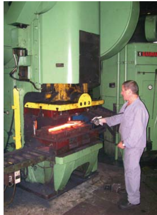
Das steirische Unternehmen Premium Parts blickt mittlerweile auf eine lange Zeit erfolgreicher Verschleißteilerzeugung zurück

Außerdem ist die Oberflächenbehandlung durch Kugelstrahlen und die Verwendung von wasserlöslichen Lacken für die Grundierung umweltfreundlich. (Kugelstrahlen ist eine Oberflächenbehandlung, bei der mittels Schleuderrad-, Druckluft-, oder Injektor-Strahlanlagen kleine Strahlmittelkör-