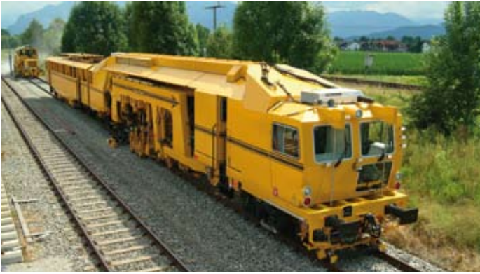
Universalstopfmaschine „UNIMAT 09-32 4S Dynamic“: mehrere Technologien in einer Maschine The UNIMAT 09-32 4S Dynamic universal tamping machine features several technologies in a single machine