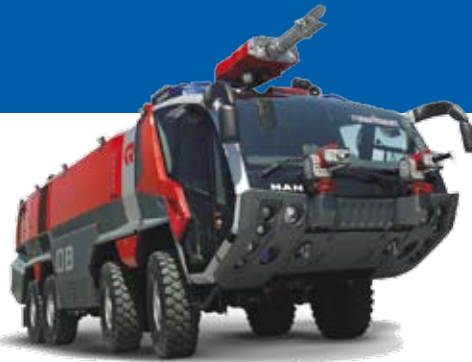
Rosenbauers Flughafenlöschfahrzeug vom Typ Panther Panther airport firefighting vehicle from Rosenbauer

130 Fahrzeuge und Ausrüstung im Wert von 30 Millionen Euro wird der Feuerwehr-ausrüster Rosenbauer aus Leonding bei Linz nach Saudi-Arabien liefern. Die Inbetriebnahme soll in mehreren Teilen bis Mitte 2010 erfolgen. Seit 2001 hat Rosenbauer insgesamt 900 Feu-