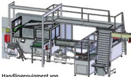
Handlingequipment von Mould & Matic

Zu Jahresende liefert der oberösterreichische Werkzeug- und Maschinenbauer Mould & Matic Solutions ein High-End-Tiefziehwerkzeug und