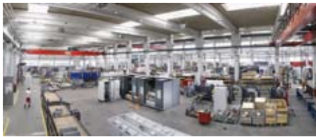
Acht Millionen Euro investierte das Maschinenbau-Unternehmen Fill in die Betriebsvergrößerung The machine maker Fill invested eight million euros to enlarge its operations

Das Maschinenbau-Unternehmen Fill aus Gurten in Oberösterreich erweitert mit einer Gesamtinvestition von acht Millionen Euro sein