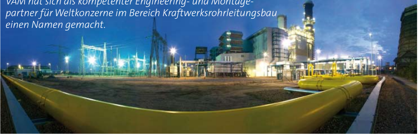
Der norwegische Energiekonzern Statkraft errichtete in Hürth-Knapsack bei Köln ein Gas- und Dampfturbinenkraftwerk The Norwegian energy group Statkraft built a modern gas and steam turbine-driven power station in Hürth-Knapsack near Cologne, Germany

VAM hat sich als kompetenter Engineering- und Montagepartner für Weltkonzerne im Bereich Kraftwerksrohrleitungsbau einen Namen gemacht.