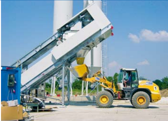
Watt Drive – Systemanbieter mechanischer und elektronischer Antriebstechnik Watt Drive – System supplier of mechanical and electronic drive technology!