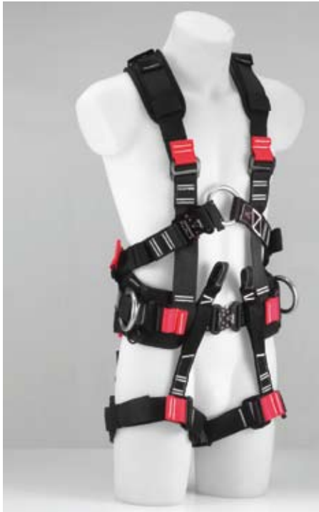
Auffanggurt Energy Pro Energy Pro safety harness

Die Firma Teufelberger hat nicht nur eine erstklassige Auswahl an Gurten, Auffang- und Haltesystemen, Sicherheitssets, Abseilsystemen, Anschlagpunkten sowie das dazugehörige Zubehör anzubieten: Neben dem Vertrieb von persönlichen Schutzausrüstungen und Berge-