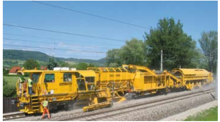
„BDS 2000“ von Plasser & Theurer: das zurzeit modernste System zur Schotterbewirtschaftung BDS 2000 from Plasser & Theurer is currently the most up-to-date system of ballast management