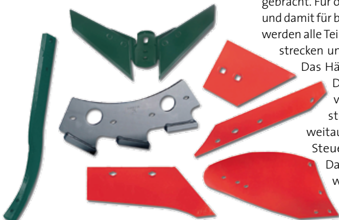
Premium Parts: hochwertige Verschleißteile für größte Beanspruchung Premium Parts delivers high quality wearing parts for withstanding maximum stress

Das steirische Unternehmen Premium Parts blickt mittlerweile auf eine lange Zeit erfolgreicher Verschleißteilerzeugung zurück. Die Erzeugnisse des Unternehmens überzeugen schon immer durch die Robustheit des Materials und durch funktionelle Technik. Gerade bei jenen Teilen, die besonderer Beanspruchung ausgesetzt sind, zeigen sich die Qualität und der Nutzen im täglichen Einsatz. Die Grubber- und Pflugverschleißteile des Spezialisten zeichnen sich besonders durch Robustheit und Funktionalität aus. Am Standort Wartberg stellt Premium Parts Verschleißteile für den