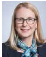
Margarete Schramböck Federal Minister of Digital and Economic Affairs