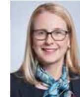
Margarete Schramböck Ministre fédérale du Numérique et de l'Attractivité économique