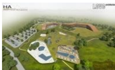
Piešťany – Slovaquie Parc aquatique et complexe touristique

En tant que partenaire touristique personnel, nous vous accompagnons afin d'optimiser tous les aspects de votre projet immobilier !