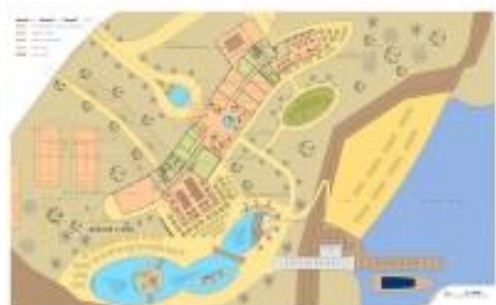
Dakar – Sénégal Hôtel de luxe et complexe touristique 5*

HAM est un prestataire de conseils global international pour l'immobilier dans le secteur de l'hôtellerie et les industries du tourisme et du loisir. Nous prodiguons des conseils techniques (architecture / domotique / design intérieur / acquisition), économiques (faisabilité, business plan, financement) et marketing (acquisition d'exploitants, marque, positionnement). Nos clients sont des entreprises actives à échelle nationale et internationale, des promoteurs de projet, des investisseurs immobiliers, des propriétaires d'hôtels, des grands bureaux d'architecte, des exploitants, des autorités touristiques et des urbanistes.