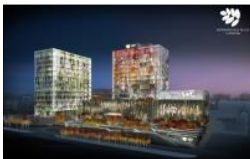
Tcheliabinsk – Russie Hôtel d'affaires et de conférences moderne 5*